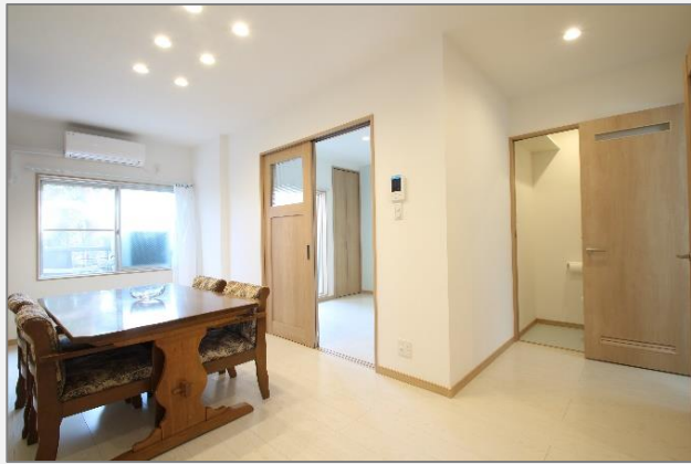
※テーブルはついてきません。